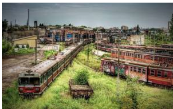
Opuštěné nádraží v Čenstochové (Częstochowa)