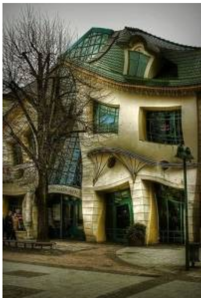
Křivý dům (Krzywy Domek) v Sopotech z roku 2004