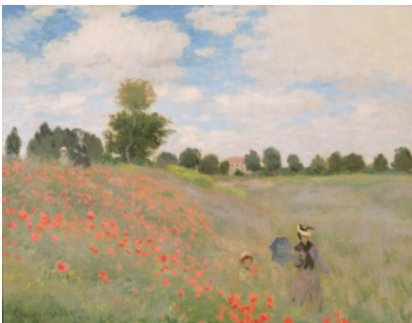
Vlčí máky v Argenteuil, Claude Monet