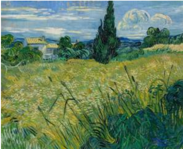
Paul Cézanne, Mont Saint Victoire