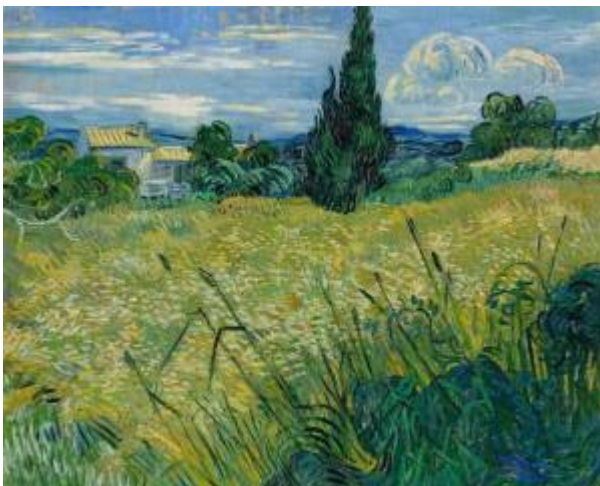
Paul Cézanne, Mont Saint Victoire

Obrázky jsou na motivy díla provensálského malíře Paula Cézanna (1839–1906), který v malbě zapojoval impresionistické výrazové formy a zároveň je označován za průkopníka klasické moderny. Mezi kupce jeho obrazů patřili jeho kolegové – například Monet a Renoir. Po Cézannově smrti se inspiroval jeho dílem Pablo Picasso.