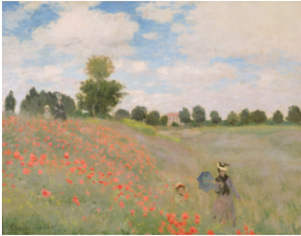
Vlčí máky v Argenteuil, Claude Monet