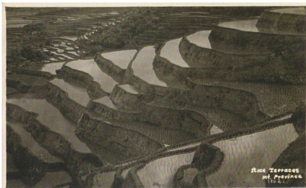
Rýžové terasy u Banaue

Zemědělci (usedlí - pěstování rýže, batátů, kukuřice, chov buvolů, koní a prasat).