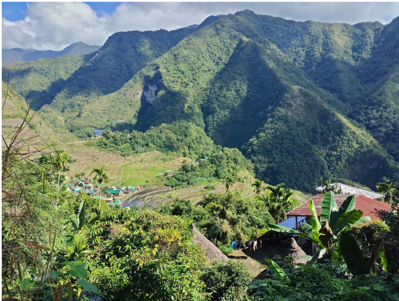
Rýžové terasy, Batad, 20. 1. 2024