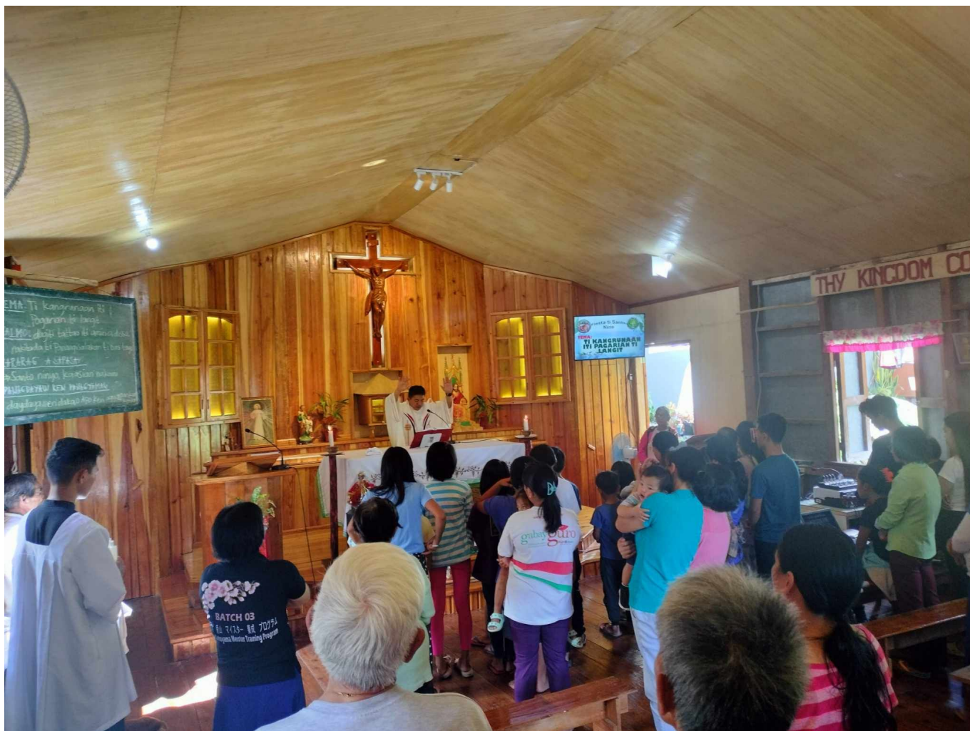
Batad, kostel Krista Krále, 20. 1. 2024