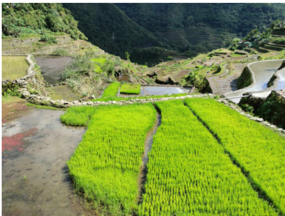
Rýžové terasy, Batad, 20. 1. 2024