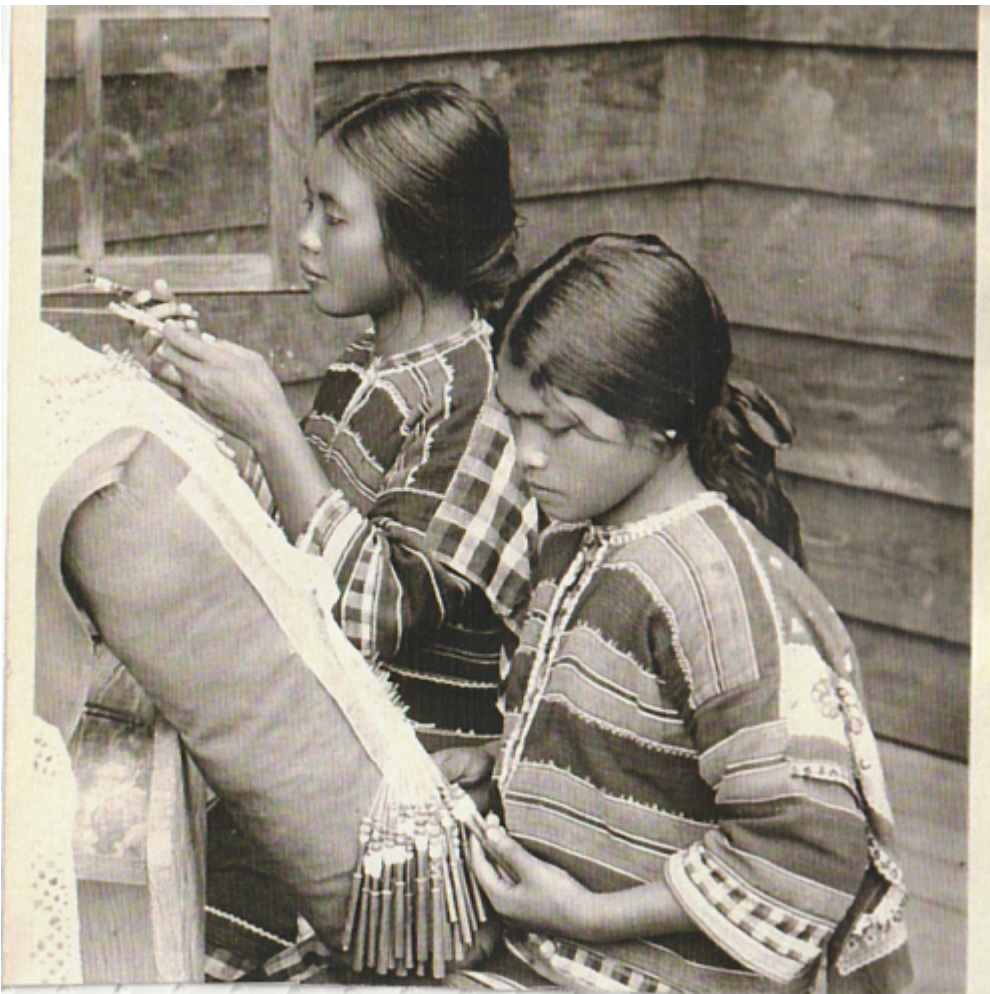
V hospodářské škole „Trinidad“ u Bayuia