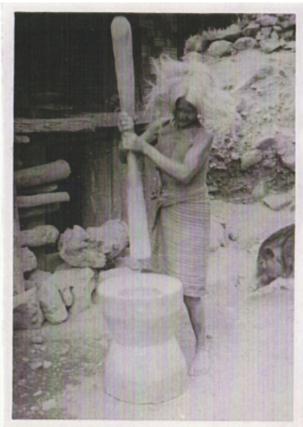
Filipínští černoši - Negritos