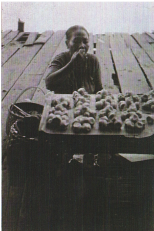
Prodavačka želvích vajec