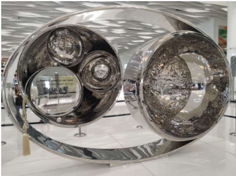
Manama, letiště, 17. 1. 2024